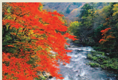
「溪谷の紅葉」(葛尾村)