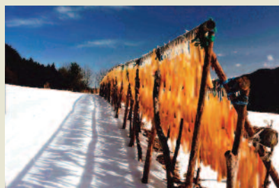
「里山のれん」(飯館村)